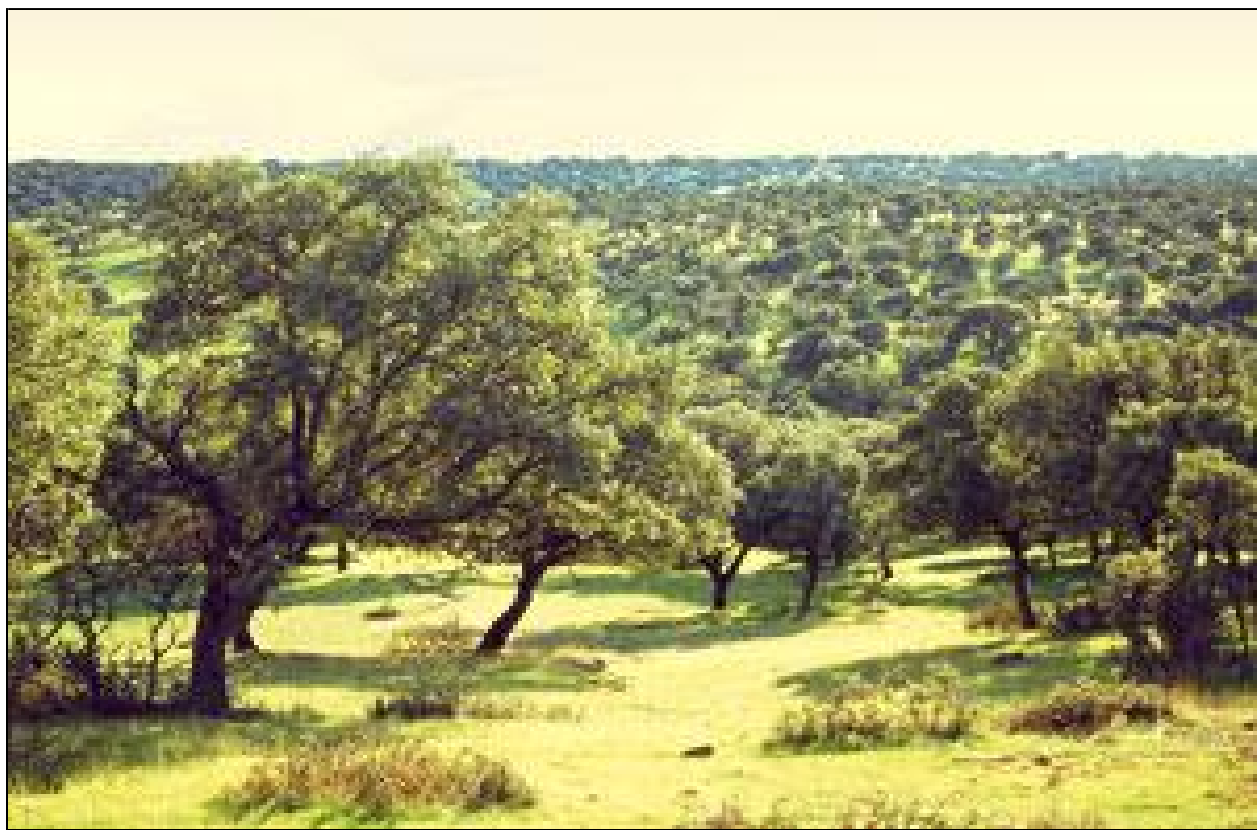
Vista general de un encinar característico de El Pardo.

La presidenta Esperanza Aguirre ha aprobado el plan de unión de la carretera M-50 en el norte de Madrid que atraviesa el monte de El Pardo.