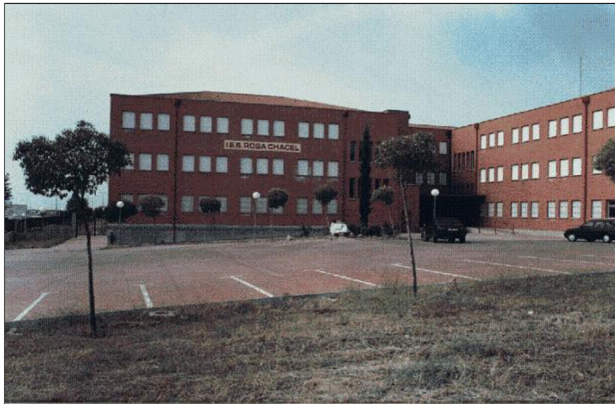
Pabellón principal del IES Rosa Chacel.