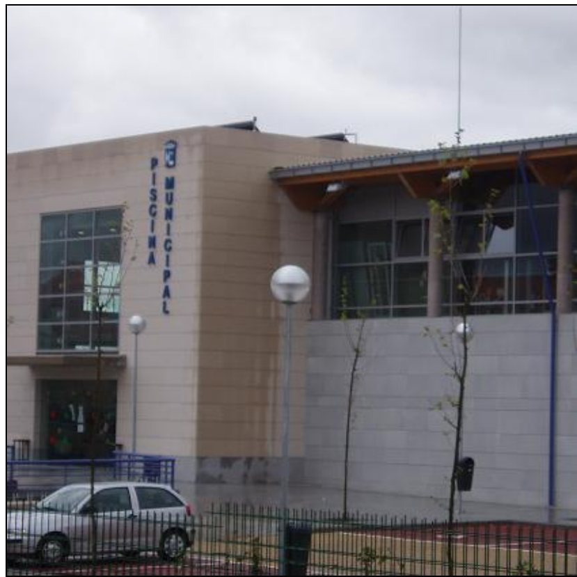
Nueva piscina cubierta de Colmenar Viejo.

El edificio, con un coste de casi cinco millones de euros, tiene una superficie de 4426 metros cuadrados distribuidos en tres plantas.